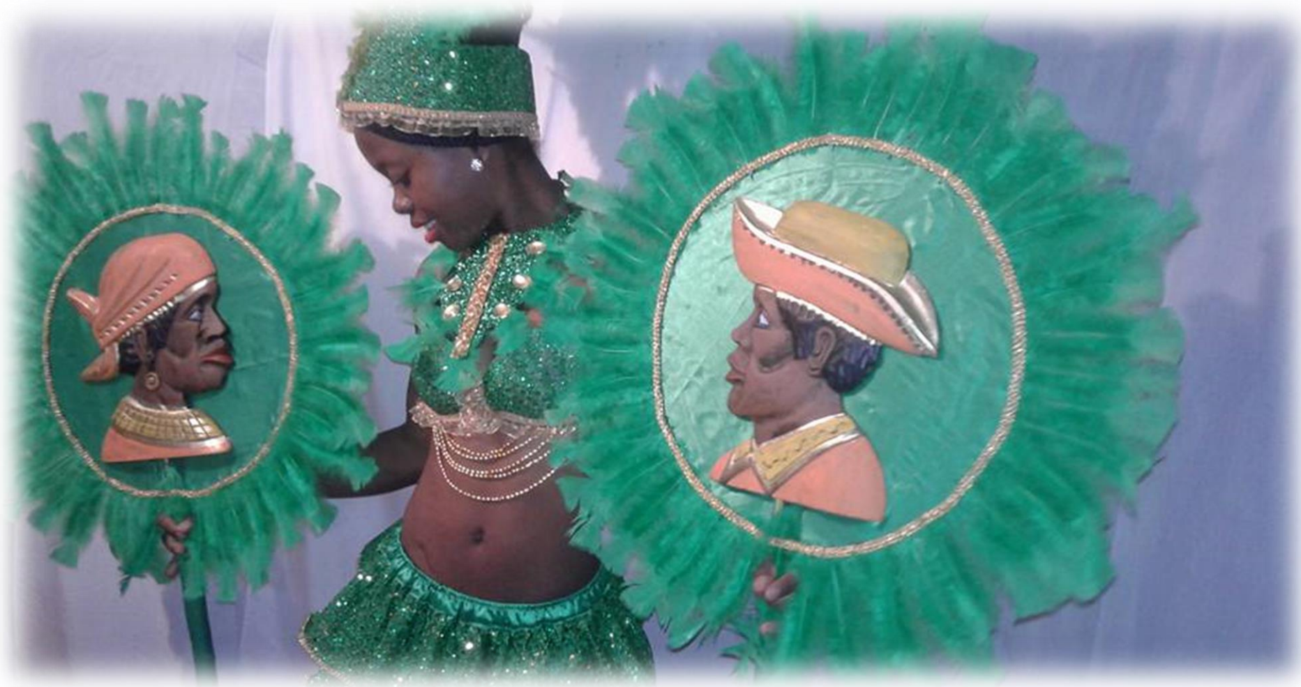
“Desfile de la Cultura Afroecuatoriana”.